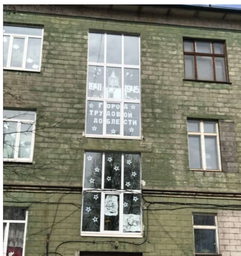
Оформление большого окна школы

С 1 по 9 мая 2021 года по всей России прошла патриотическая акция «Окна Победы», в рамках которой участникам предлагалось украсить окна своих квартир, домов, офисов символикой Великой Победы. Впервые украшение окон победной атрибутикой состоялось в 2020 году, когда в стране был введен строгий режим самоизоляции. Активисты нашей школы также присоединились к акции и оформили фасад школы.