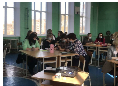
Первая часть семинара