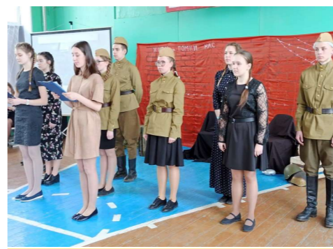
Выступление 10-го класса

Основной целью семинара-практикума было поделиться опытом работы нашей школы на пути к