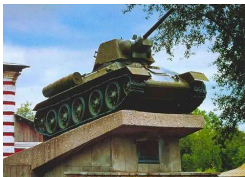
Т-34, образец 1940 года

Значительный вклад в дело победы над врагом внес коллектив Нижнетагильского огнеупорного завода. Он в короткое время в совершенстве освоил изготовление сталеразливочного припаса: стопорных и литниковых трубок, сифонов, звездочек, воронок, стаканов, пробок, – которые шли отсюда в маргеновские цехи металлургических, машиностроительных заводов не только Урала, но и многих других предприятий страны. На Уралвагонзаводе родились поточные линии. Обработка деталей расчленилась на десятки операций и значительно упрощалась, а это давало возможность новичкам быстро освоить производство. Так целые участки становились передовыми. Уралвагонза-