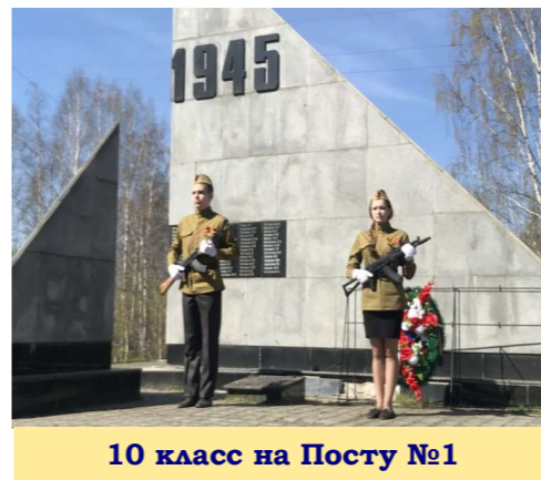
10 класс на Посту №1

В преддверии празднования 76-й годовщины Победы в Великой Отечественной войне в Нижнем Тагиле традиционно проходит акция «Пост №1». 7.05.2021 г. юнармейцы школьного отряда «Виктория» с честью и достоинством несли вахту памяти у Мемориала погибшим горнякам.